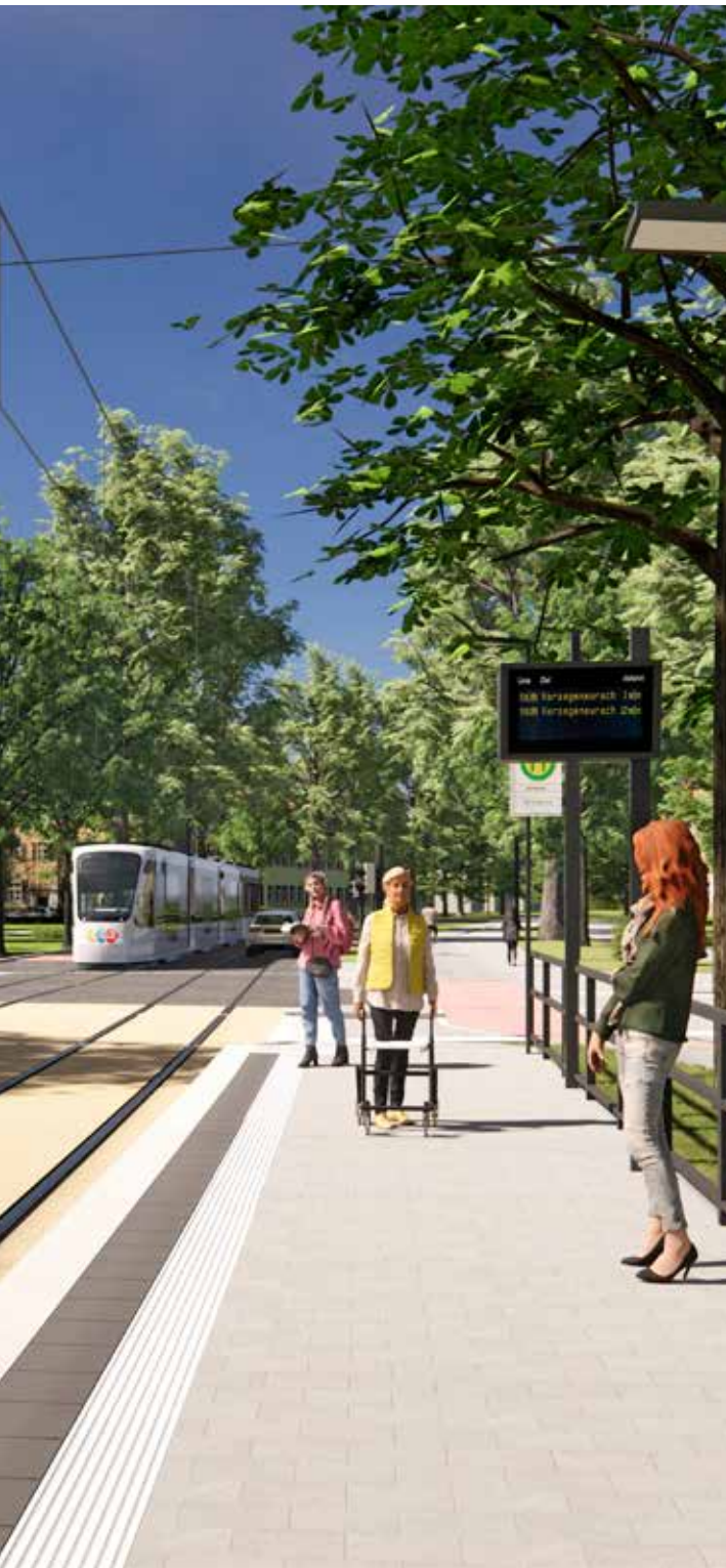
Visualisierung Stadt-Umland-Bahn: Nürnberger Straße, Erlangen; Blick auf die Haltestelle „Ohmplatz“ in Richtung Erlanger Innenstadt. Stand: Juli 2023